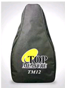
TM12 Carry Bag