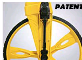
C. Patent protected gear transmission design