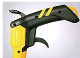
A. Brake trigger and re-set trigger