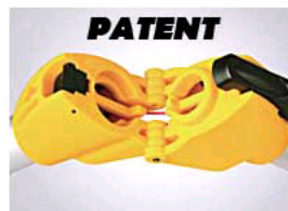
B. Patent protected wrist design